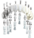
CAD & LIBRERÍA Librería de Implantes & Librería de Análogos Implants library & Abutments library