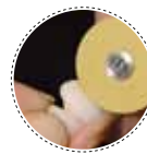
FRESAS GT-MEDICAL Fresas para pulido de zirconio. Dental burs for polishing zirconium.