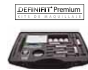
DEFINIFIT PREMIUM Kit de Maquillaje para esmaltar y maquillar Makeup kit to glaze and make up.